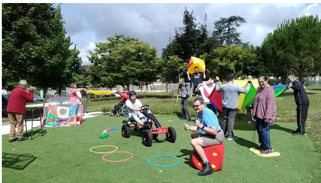
Photo gagnante du concours photo Activités Motrices 2021

Les gagnants seront invités à renvoyer une ou plusieurs photos des dotations reçues.