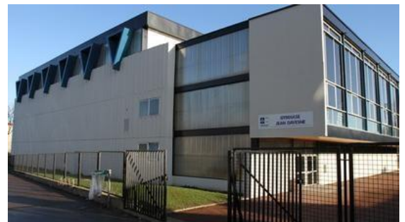
Gymnase Jean DAVESNE - SOISSONS

Si vous souhaitez obtenir des réponses précises sur le plan technique autres que celles annoncées, veuillez adresser vos questions préalablement à alexandre_borg@yahoo.fr