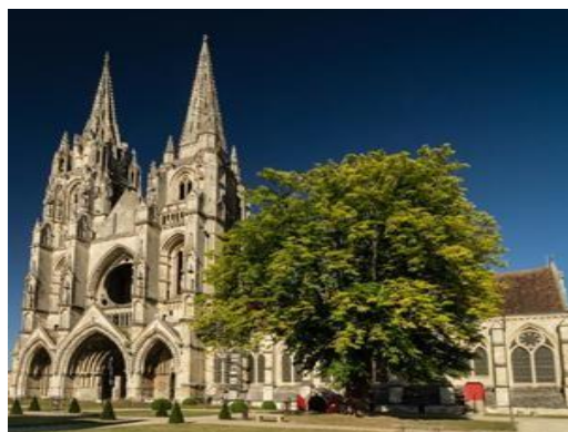
Abbaye St Jean des Vignes - SOISSONS

Depuis fort longtemps, les terres fertiles du Soissonnais produisent des légumes de qualité. Cela fait plus de deux siècles que l'on mentionne l'existence d'un fameux haricot autour de la ville de Soissons.