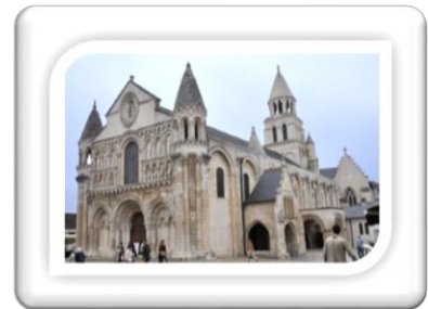
Notre Dame le Grande

Poitiers constitue le chef-lieu du département de la Vienne. Cette ville était aussi la capitale régionale de l'Ex-Poitou-Charentes. Cette position régionale importante fut permise par une importante empreinte historique. En guise d'exemple, nous pouvons citer Sainte Radegonde qui créa à Poitiers au VI ème siècle la première abbaye française exclusivement féminine. Par ailleurs la ville est nommée « ville aux cent clochers » pour ses nombreuses églises. Nous vous invitons à prendre du plaisir et à flâner dans les rues et ruelles du vieux Poitiers où vous attendent de nombreuses surprises architecturales et historiques.