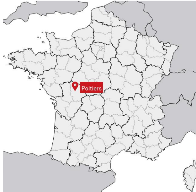
Localisation de Poitiers en France